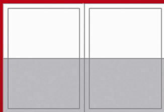
DOBLE MEDIA PÁGINA 165 mm x 480 mm

DATOS TÉCNICOS: sistema de impresión huecograbado